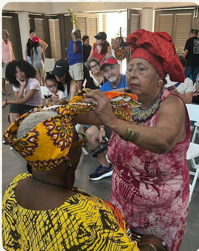
Taller de turbantes como parte de nuestros eventos culturales.

Actualmente es co-manejado por la Fundación Amigos de El Yunque y varias otras instituciones. En El Portal coordinamos y organizamos toda la programación educativa y cultural para la comunidad como festivales, talleres, conferencias, música en vivo y actividades de bienestar.