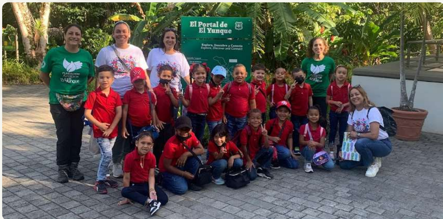
Grupo de estudiantes participando en nuestras Experiencias de Inmersión en la Naturaleza.