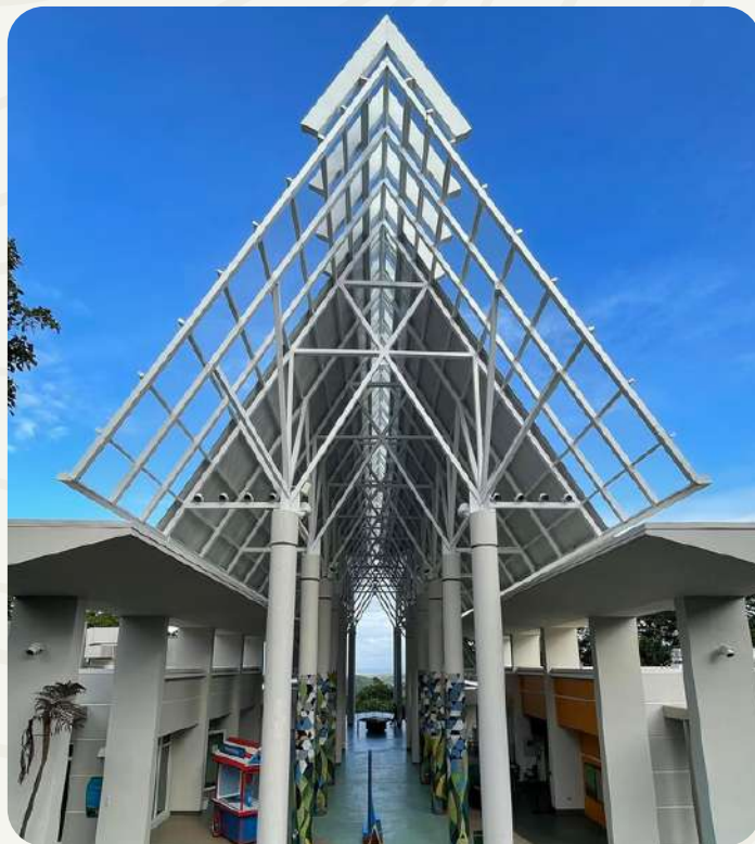
Celebra tu evento en El Portal de El Yunque.

También es una de las estructuras arquitectónicas más ecoeficientes del país. Los eventos comerciales de El Portal se gestionan en parte con el apoyo de nuestro socio 7.29 Event Planning & Venue Management .