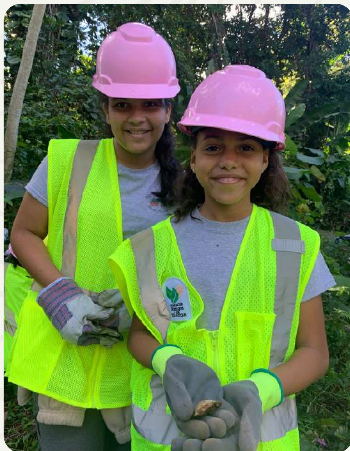
Estudiantes aprendiendo sobre la biodiversidad de El Yunque.