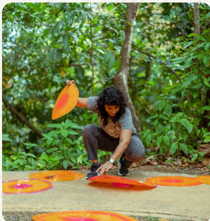
El Portal del Yunque: Presencia y Lique (2023) de Ivelisse Jiménez.

NATURA es una exploración poética en la intersección del arte, la naturaleza y El Yunque. Las obras abordan temas que incluyen las dimensiones políticas del paisaje, la biodiversidad, el suelo, las tradiciones y las conexiones ancestrales con El Yunque.