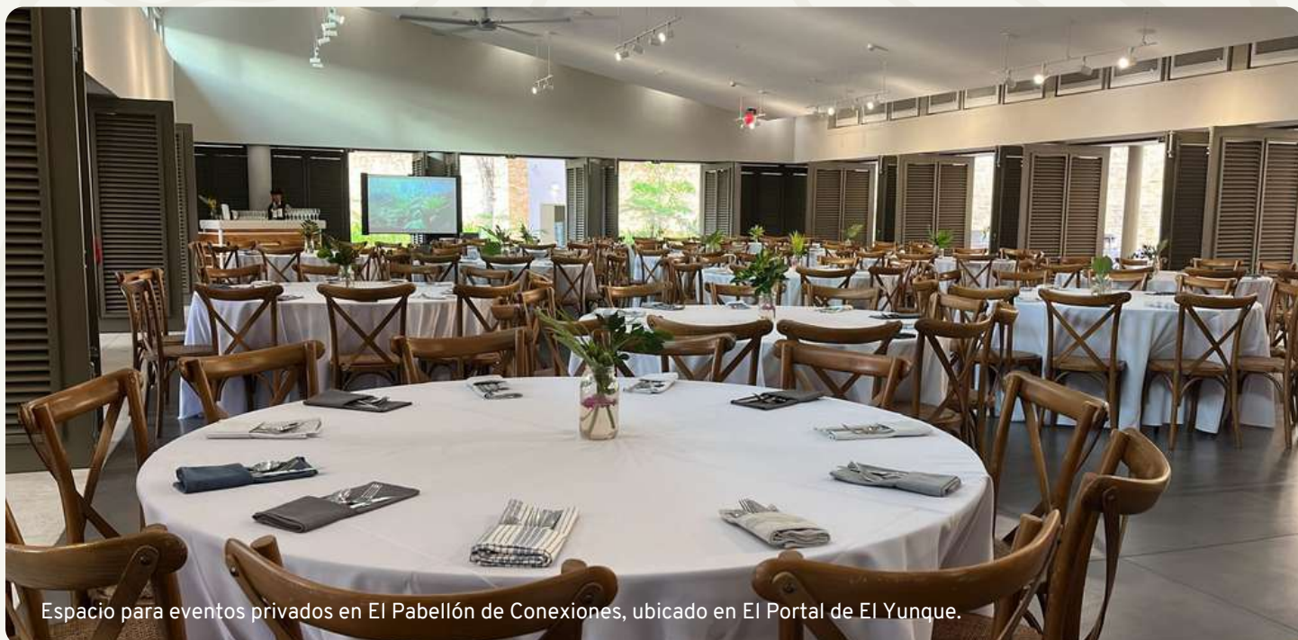
Espacio para eventos privados en El Pabellón de Conexiones, ubicado en El Portal de El Yunque.