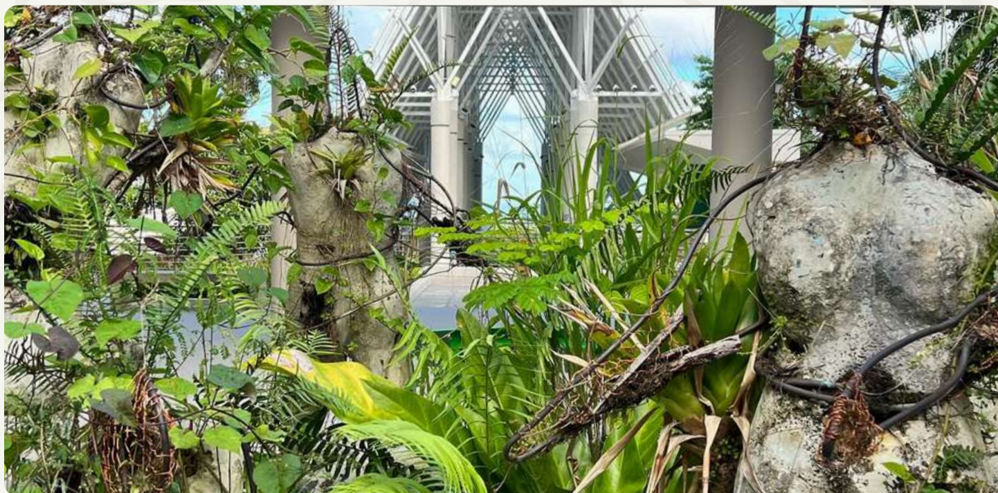
El Portal de El Yunque, Río Grande