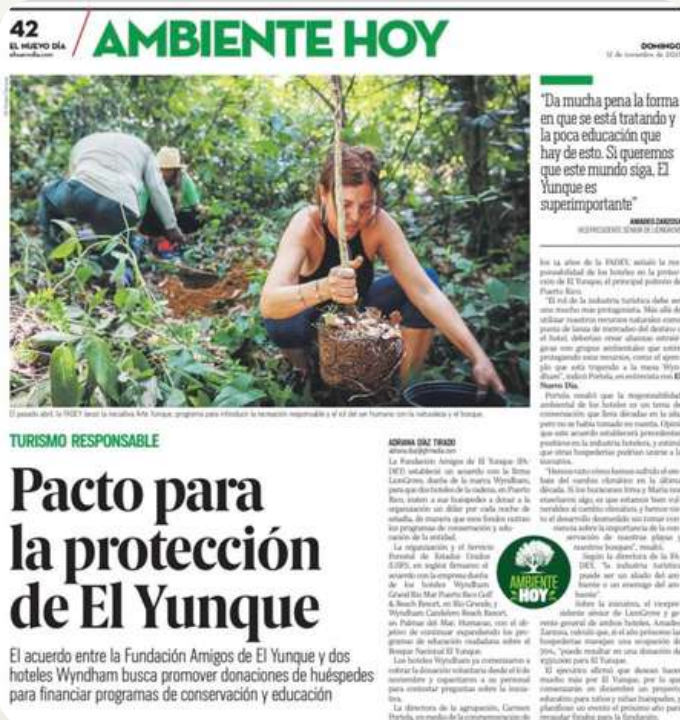
“Pacto por la protección de El Yunque”, artículo escrito por Adriana Tirado Díaz publicado en el El Nuevo Día .

Esta iniciativa es histórica en Puerto Rico y muestra cómo la industria hotelera y el sector de conservación ambiental pueden colaborar a favor de la protección de nuestros recursos naturales. Esperamos expandir este programa a hoteles, Bed & Breakfasts e industrias adicionales en la isla.