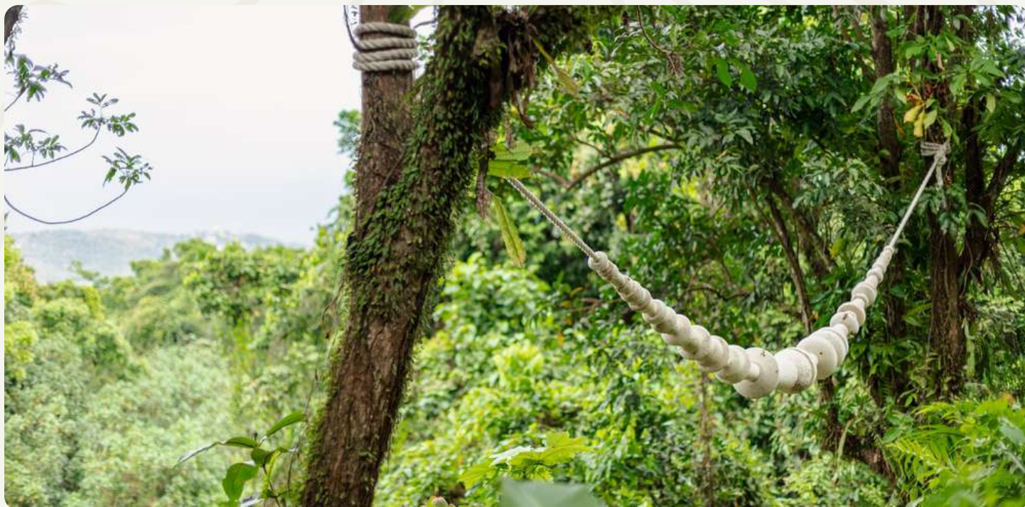
Memoriam (2023) de Jaime y Javier Suárez.